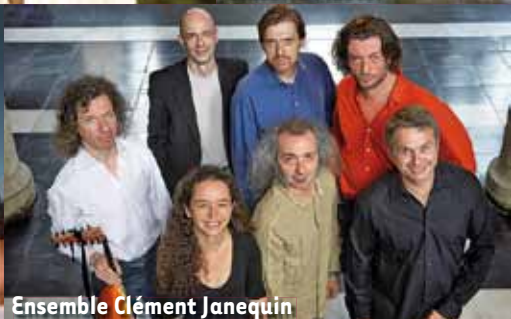
Ensemble Clément Janequin